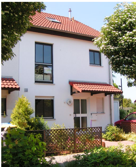
In der Erfurter Straße hat die degewo bereits Reihenhäuser realisiert